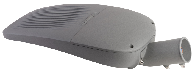
Das Netzteil ist vom LED Modul abgetrennt